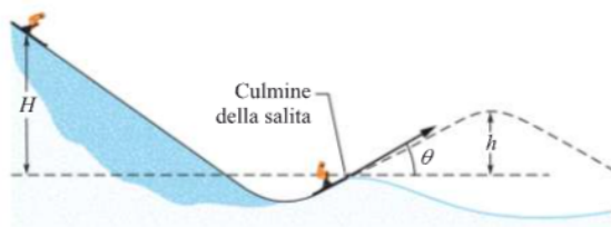
FIG. 1: Esercizio 3

Esercizio 3 Uno sciatore di massa m = 60\text{ kg} parte da fermo da un' altezza H = 20\text{ m} rispetto al culmine di un trampolino di salto, come illustrato in figura. Allo stacco dal trampolino la sua direzione forma un angolo \theta = 28^\circ con il piano orizzontale. Trascuriamo l'attrito e la resistenza dell'aria. (a) Quanto varrà la massima altezza h raggiunta rispetto al punto di stacco? (b) Aumenta, diminuisce o resta invariata, se lo sciatore ora ripete il salto con un pesante zaino?