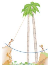
FIG. 3: Esercizio 8

Esercizio 8 Tarzan, che pesa P = 688 \text{ N} , salta da una roccia appeso a una provvidenziale liana lunga l = 18 \text{ m} . Dall'alto della roccia al punto piú basso della sua oscillazione il dislivello é h = 3,2 \text{ m} . La liana é soggetta a rompersi se la tensione su di essa supera T = 950 \text{ N} . (a) Arriverá rompersi? (b) Se si, indicare a quale angolo \theta rispetto alla verticale si rompe. Se no, calcolare la massima tensione T_M che deve sopportare.