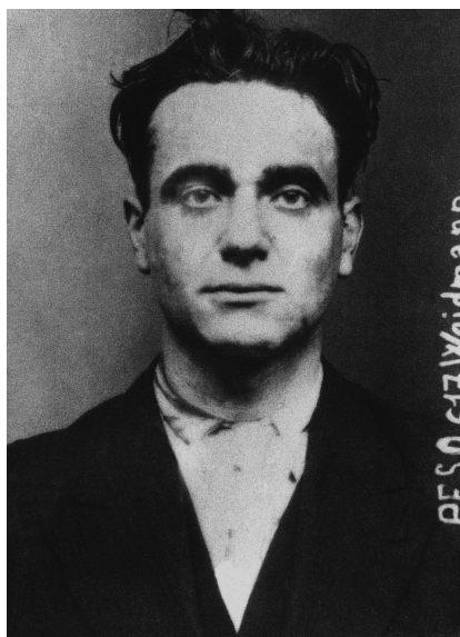
Eugen Weidmann. Criminale tedesco, ultimo condannato a morte a subire un'esecuzione pubblica in Francia. Giustiziato a Versailles nel 1939.