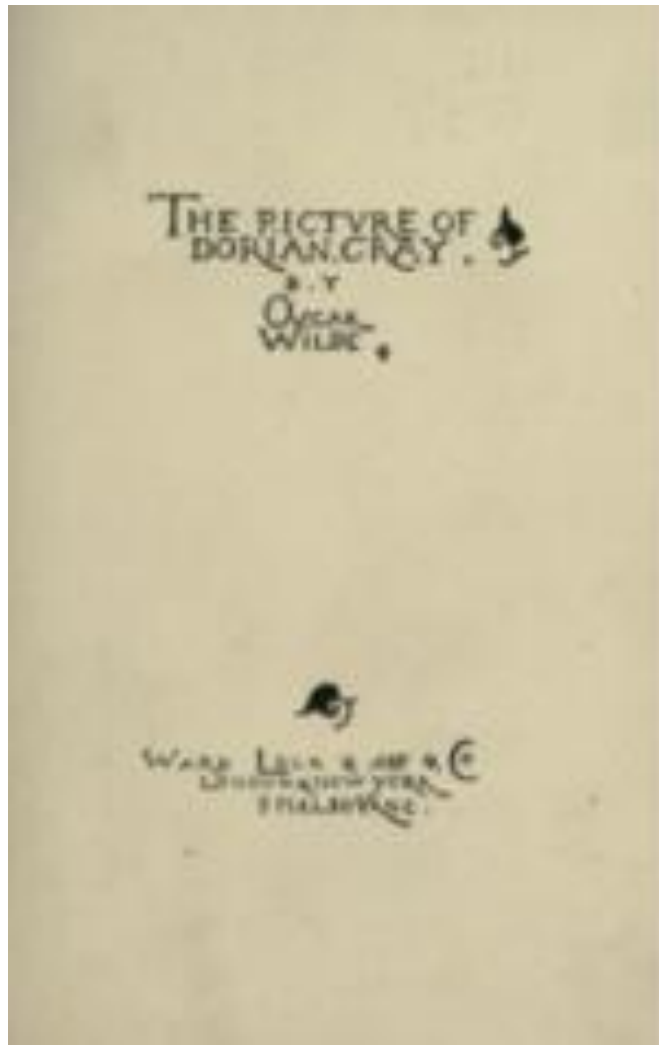
The Picture of Dorian Gray