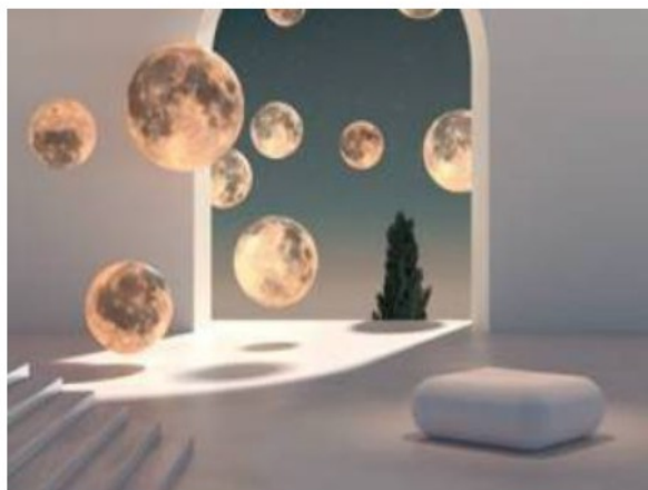
© Plasticbionic – Costume 3 pièces, 2024

La Nuit européenne des musées est un événement qui se déroule dans plus de 3 000 musées, et près de 30 pays européens ! A cette occasion, les musées ouvrent le soir, gratuitement leurs portes et proposent des animations variées. Une occasion unique de découvrir les collections permanentes et expositions temporaires mises en valeur. Un programme d'éducation artistique et