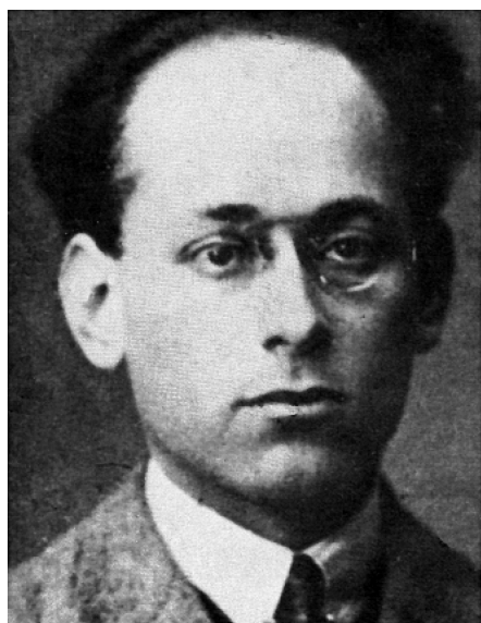
Piero Sraffa (1925) Angelo Tasca (1922)