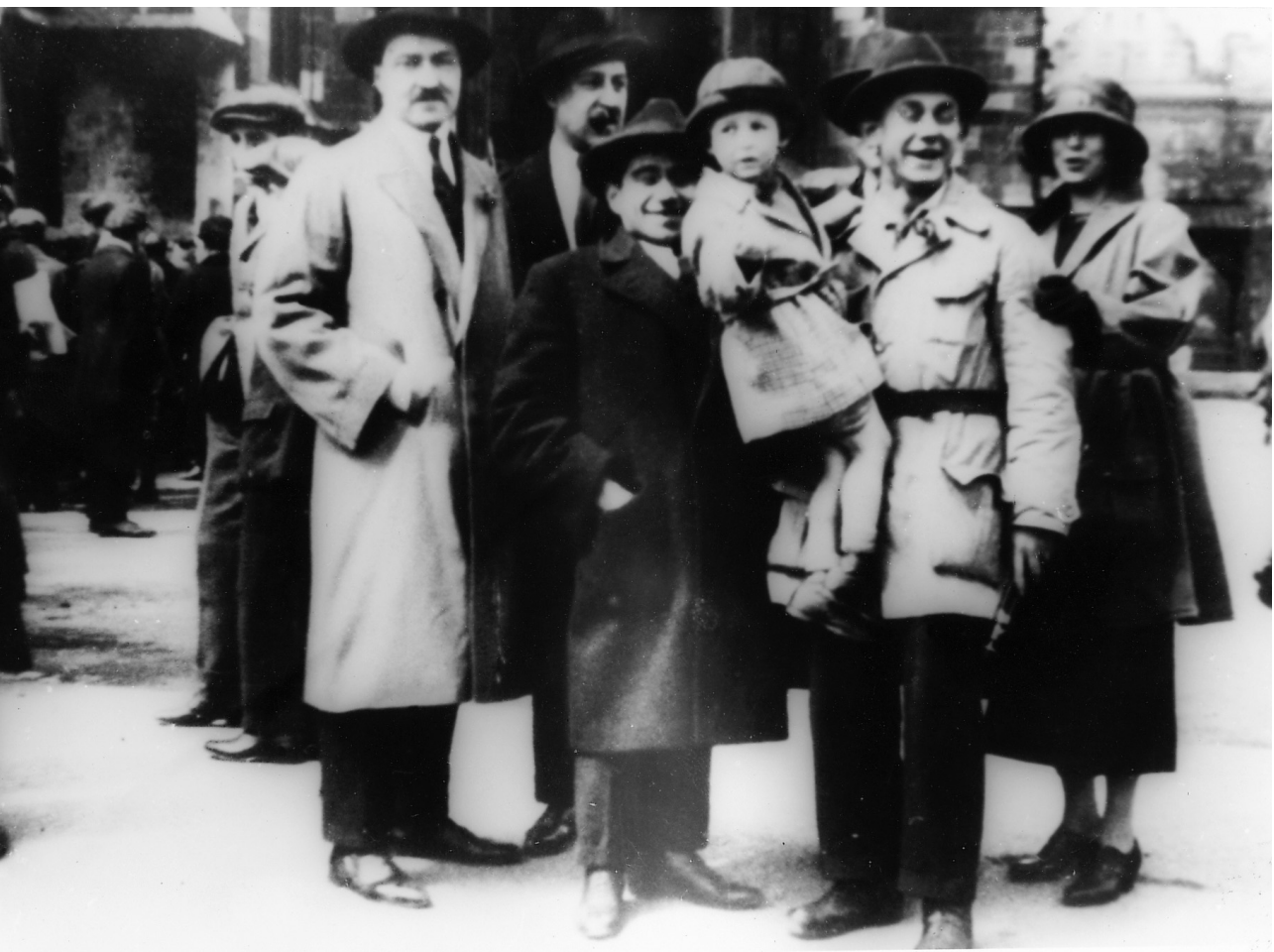
Gramsci a Vienna (fine 1923)