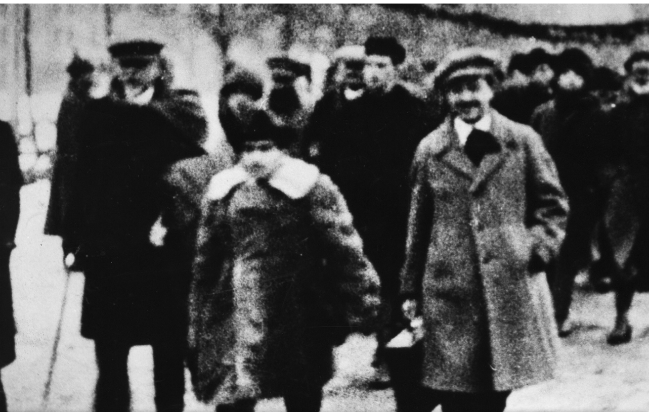
Mosca, dicembre 1922. Gramsci al IV congresso dell'Internazionale comunista