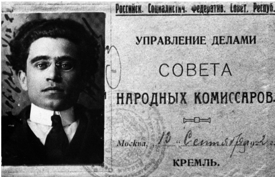
Mosca, dicembre 1922. Gramsci al IV congresso dell'Internazionale comunista Tessera di riconoscimento per l'accesso al Cremlino (1922)