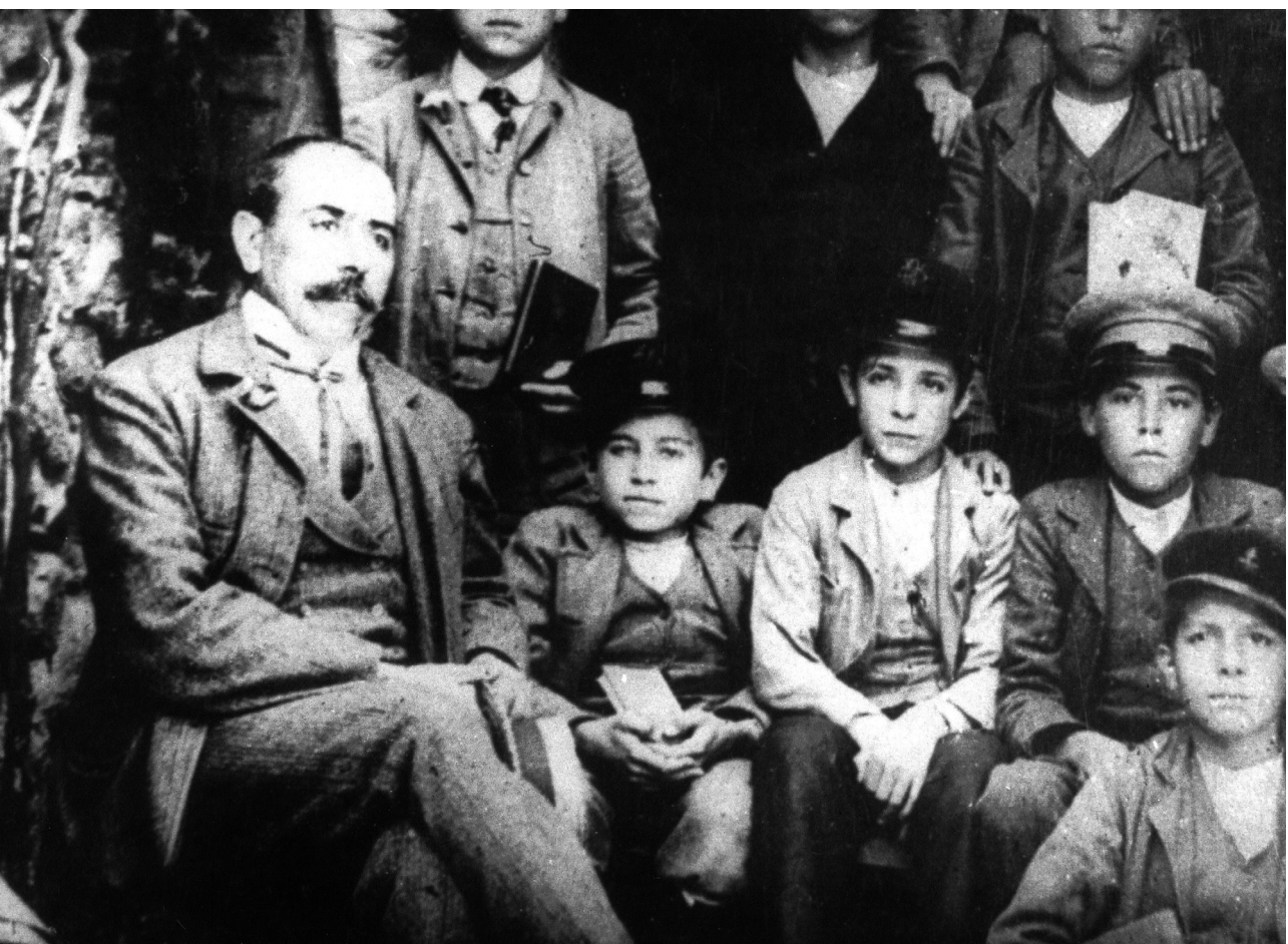
Antonio Gramsci, al centro, in una foto scolastica (1900 circa)