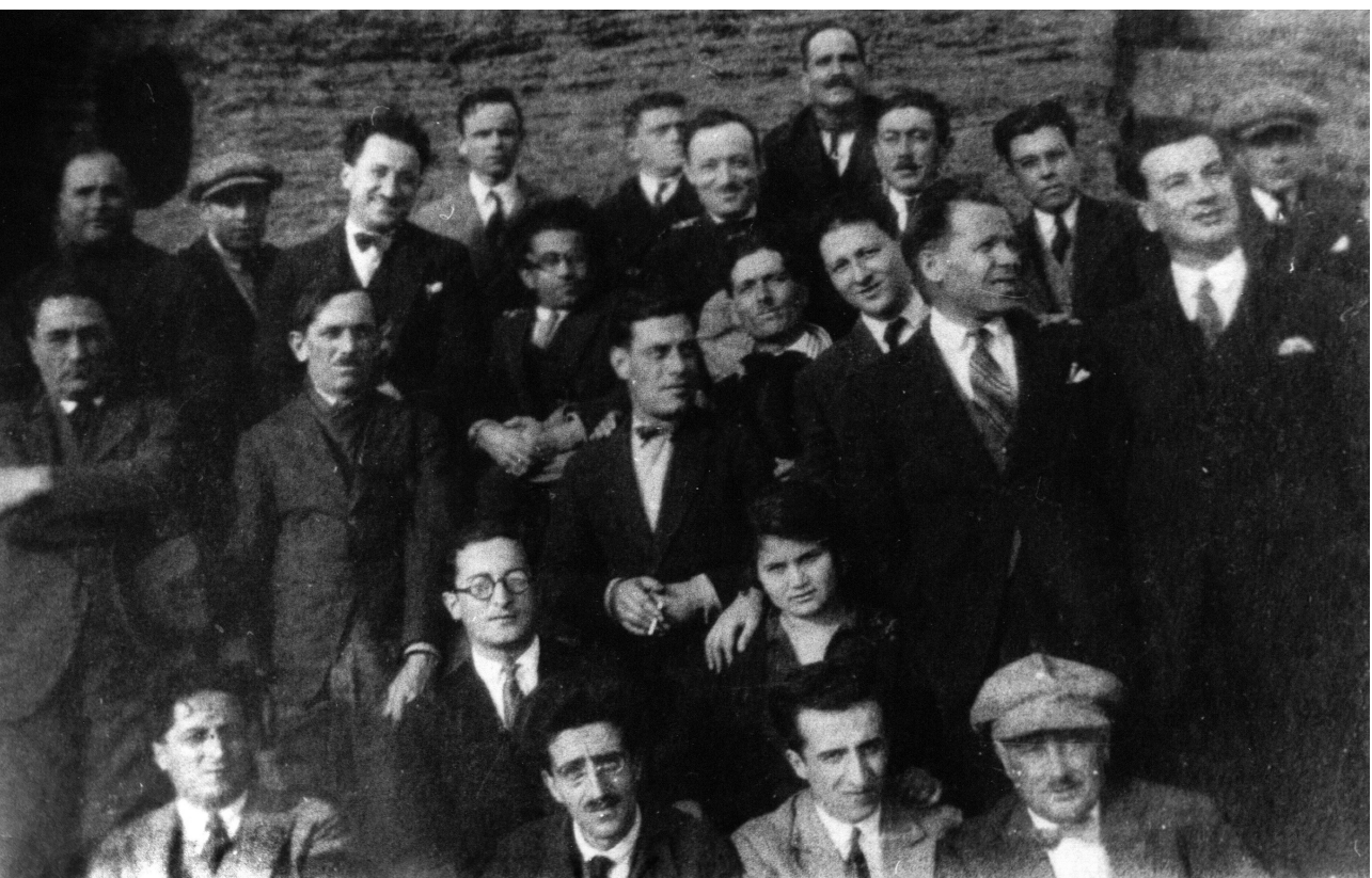
Gramsci tra i confinati di Ustica (fine 1926)