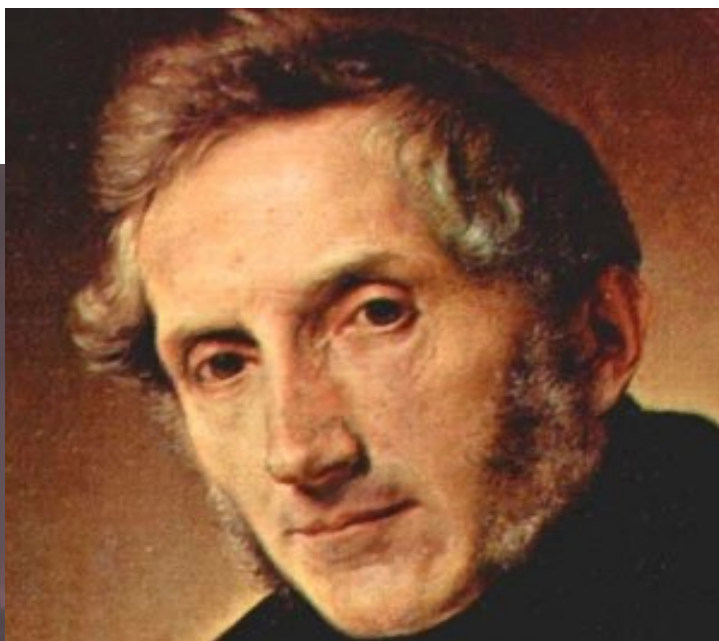
Alessandro Manzoni 1785-1873