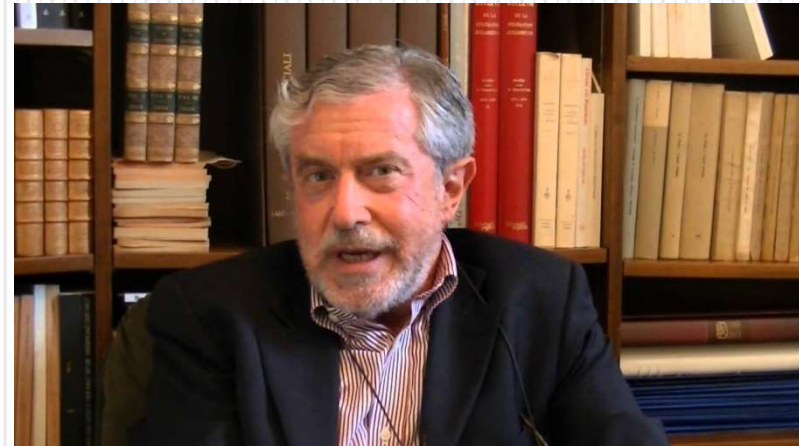
Enzo Mingione è professore emerito di sociologia generale all'Università di Milano Bicocca