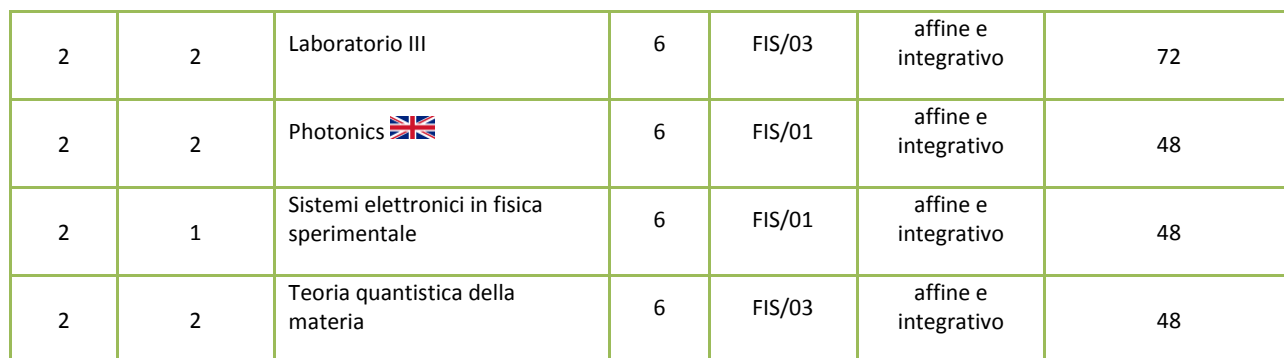
Tabella E Affini e integrativi a scelta erogati da altri CdS