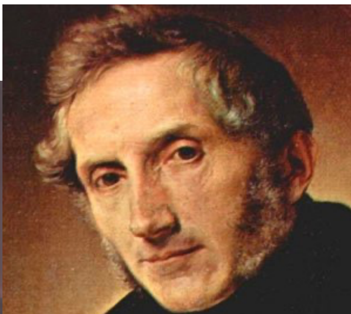
Alessandro Manzoni 1785-1873