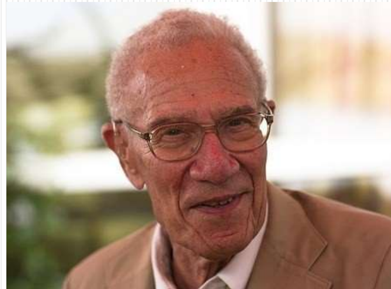
Robert M. Solow (1926) è un economista statunitense, premio Nobel per l'economia nel 1987

(R. Solow, Il mercato del lavoro come istituzione sociale , Il Mulino, 1994)