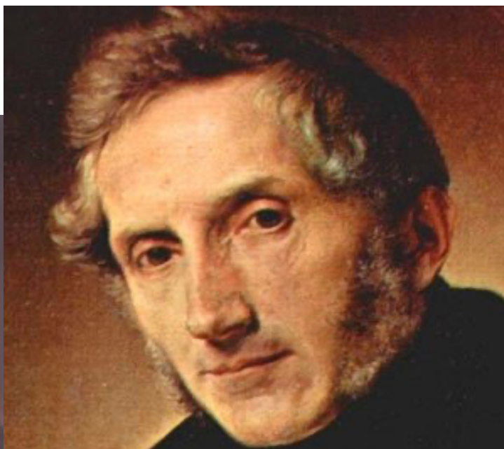
Alessandro Manzoni 1785-1873