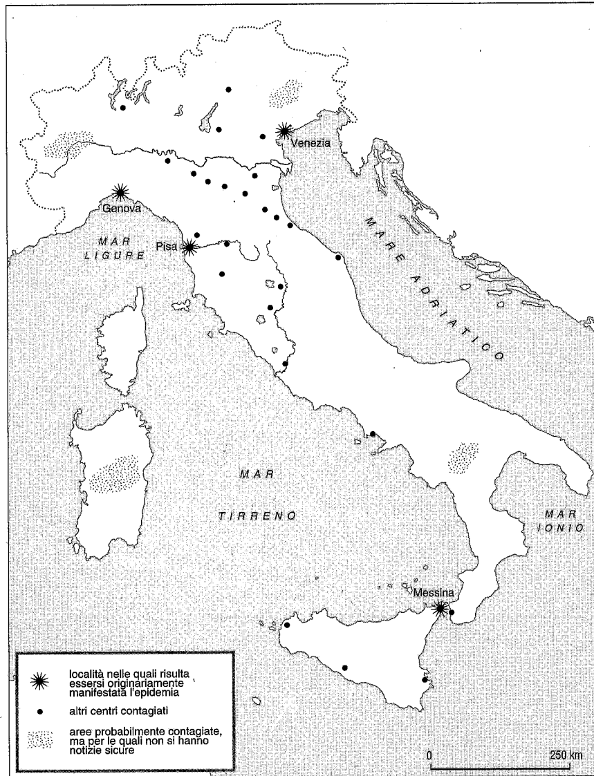
Figura 10. La diffusione della peste del 1348.