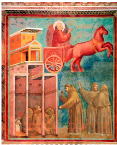
La visione del troni celesti