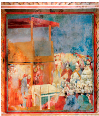
La santificazione di Francesco