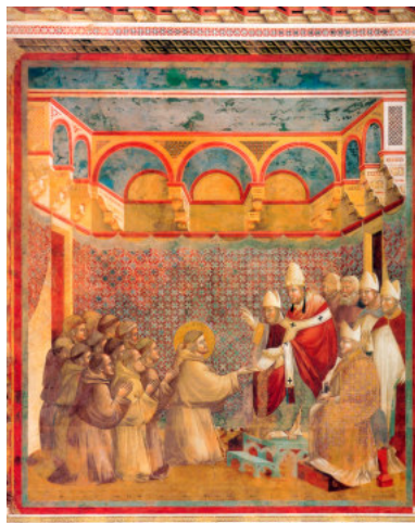
L'approvazione della Regola daparte di Inncenzo III