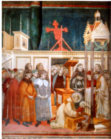
Il presepe di Greccio