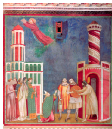
La liberazione dell'eretico Pietro d'Assisi