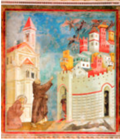
La cacciata dei diavoli da Arezzo