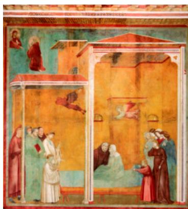
La confessione di una donna resuscitata