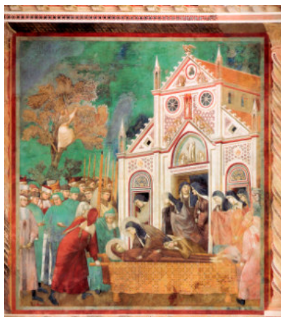
Il pianto di Chiara e delle compagne