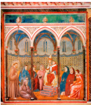
La predica davanti a Onorio III