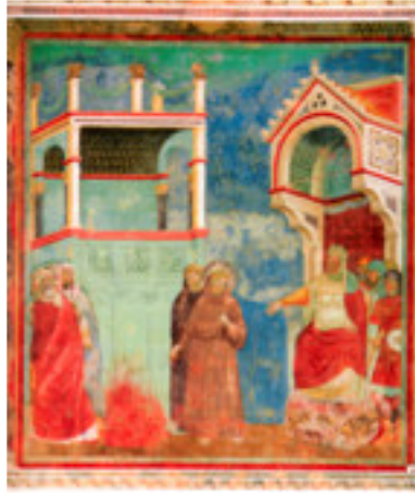
La prova del fuoco Davanti al sultano