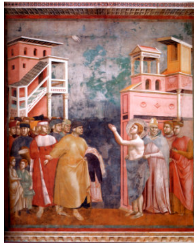
La rinuncia ai beni paterni