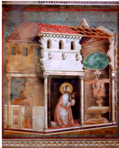
La preghiera in San Damiano