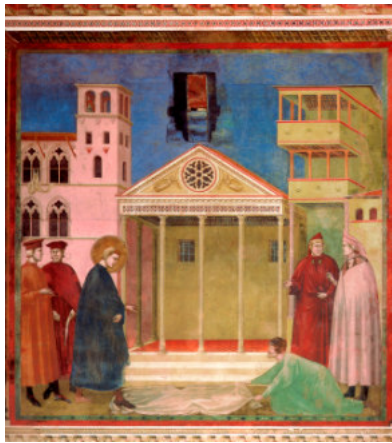
Francesco onorato da un uomo semplice