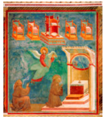
La visione del carro di fuoco