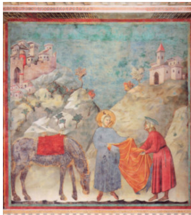
Francesco dona il suo mantello a un cavaliere caduto in povertà