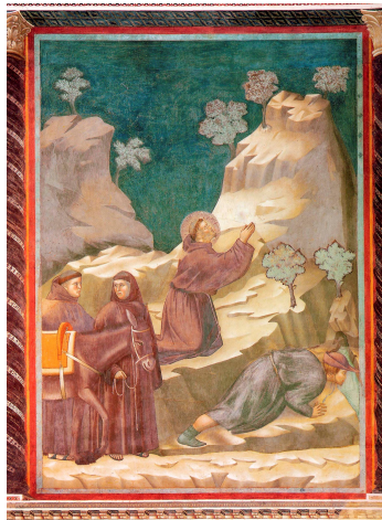
Il miracolo della fonte