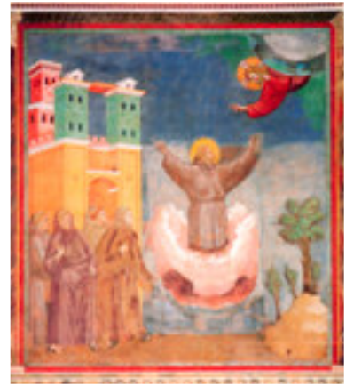
L'estasi di Francesco