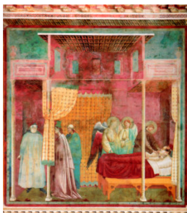
La guarigione di Giovanni di Lerida