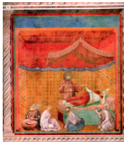
Francesco appare in sogno a papa Gregorio IX