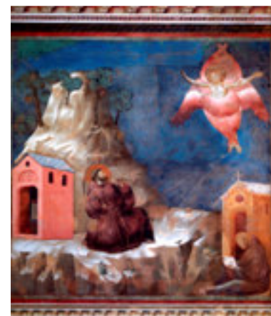
Francesco riceve le Stimmate sulla Verna