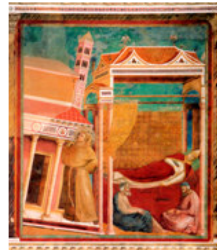
Il sogno del Laterano cadente