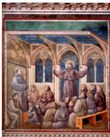
L'apparizione al capitolo di Arles