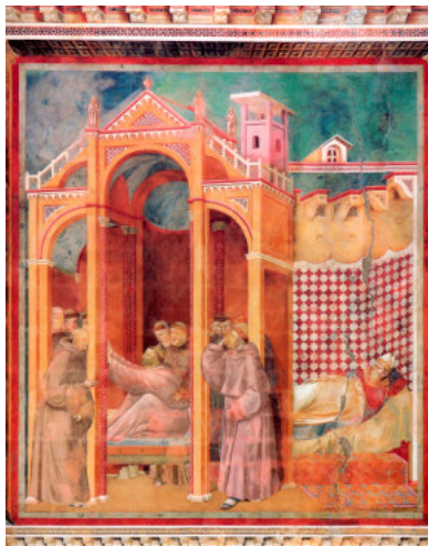
La visione di frate Agostino