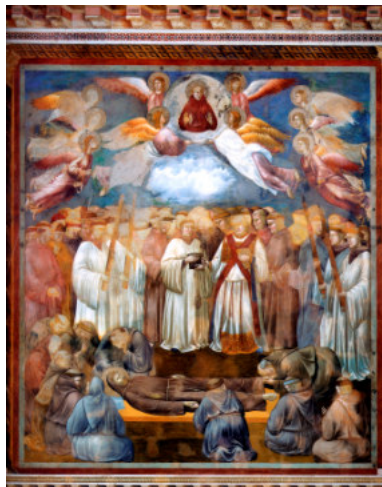
La morte di Francesco