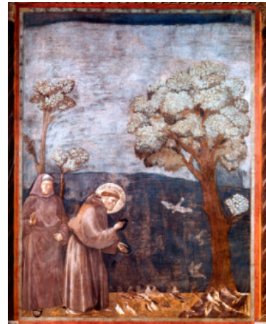
La predica agli uccelli